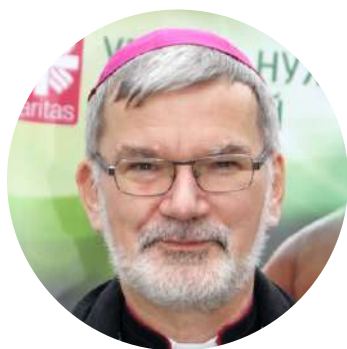
ЕПИСКОП КЛЕМЕНС ПИККЕЛЬ Президент