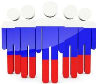
АНО Поволжский центр поддержки СО НКО