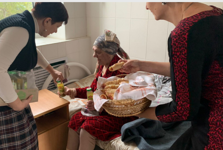
Волгоград, Праздник для приюта «Милосердие»

В Волгограде сотрудники Каритас подготовили выпечку и концерт и навестили социальный приют «Милосердие» в посёлке Соляной Красноармейского района.