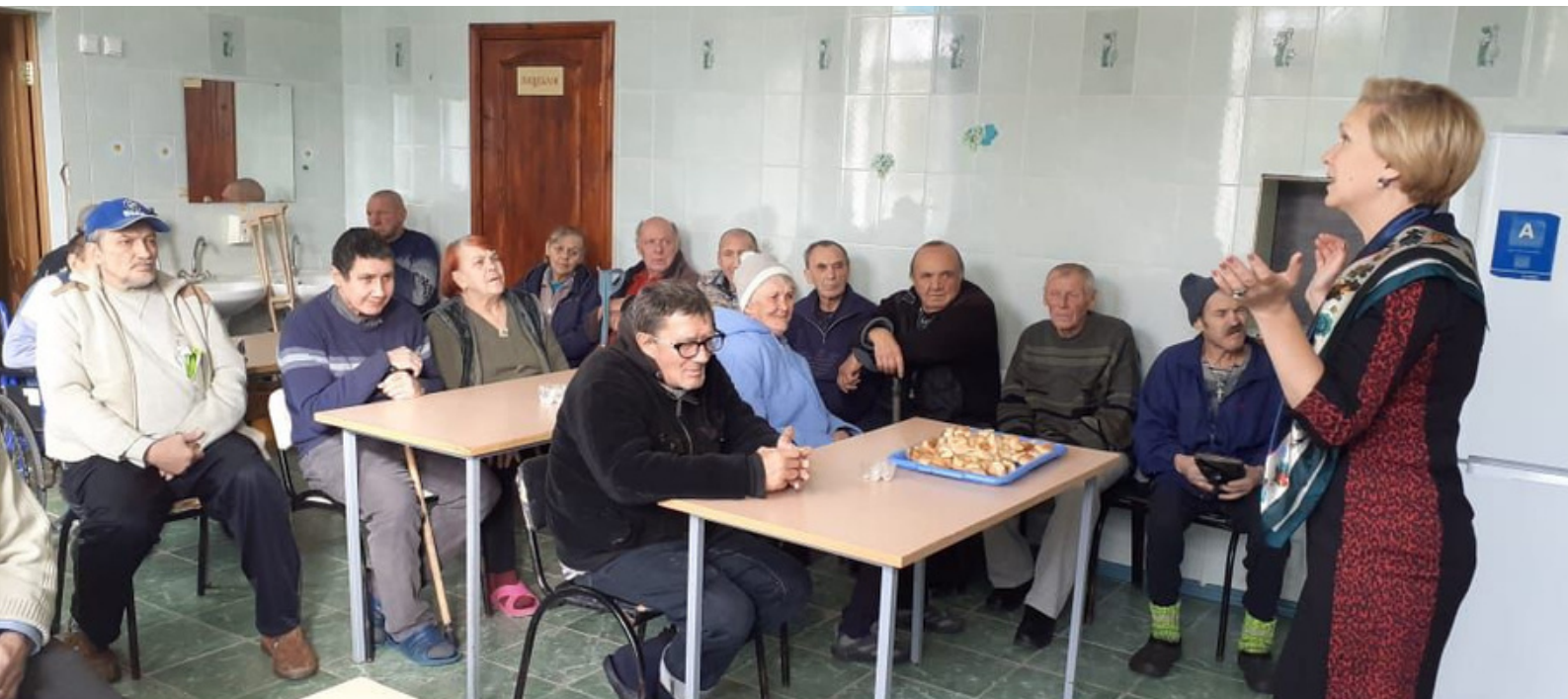
Волгоград, Благотворительный обед для одиноких

Также в Волгограде был организован благотворительный обед и праздничная программа для престарелых, одиноких и беженцев.