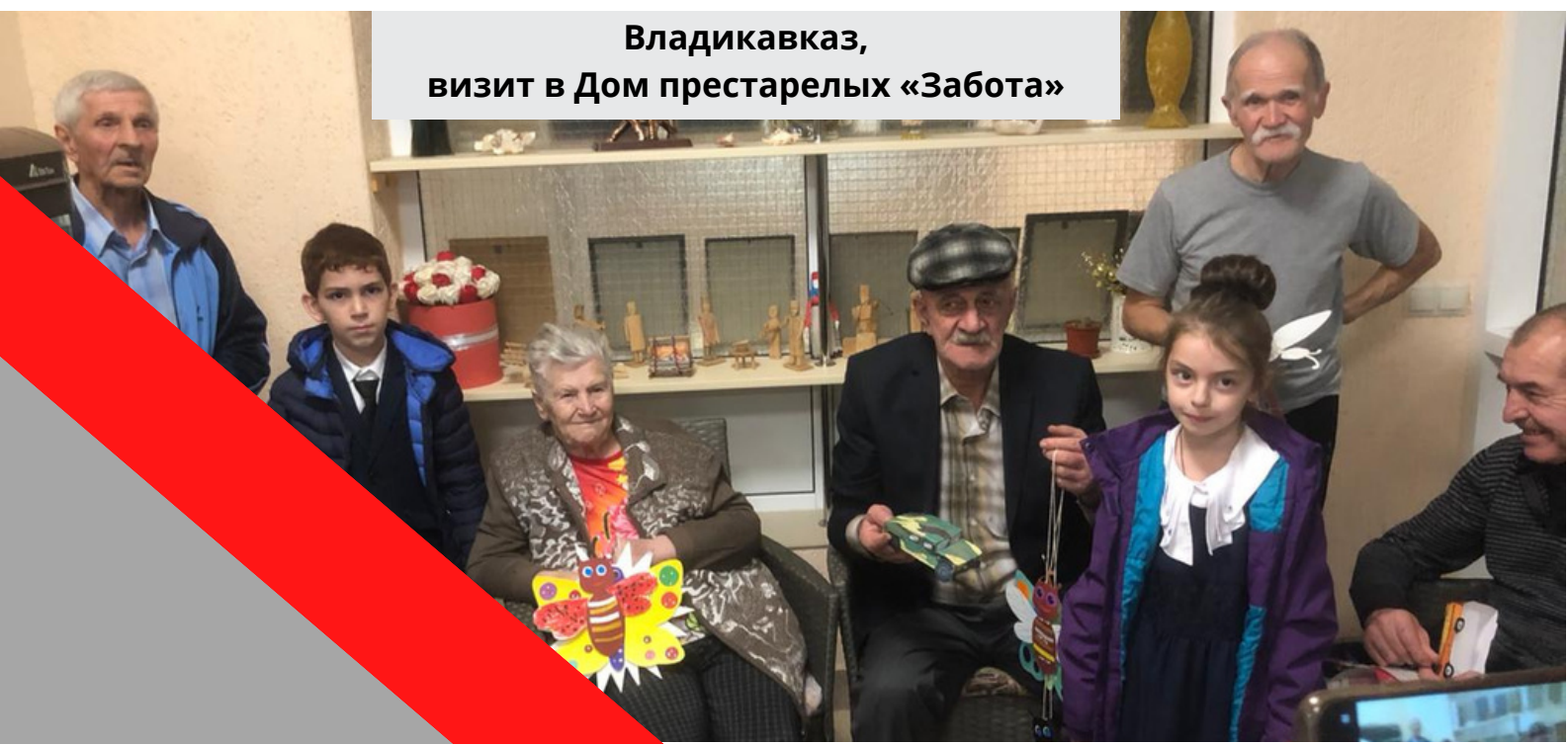
Владикавказ, визит в Дом престарелых «Забота»

В Марксе сотрудники Патронажной службы на собственные средства купили фрукты и посетили с такими «Витамишками внимания» всех своих подопечных - в добавок к обычным патронажам.