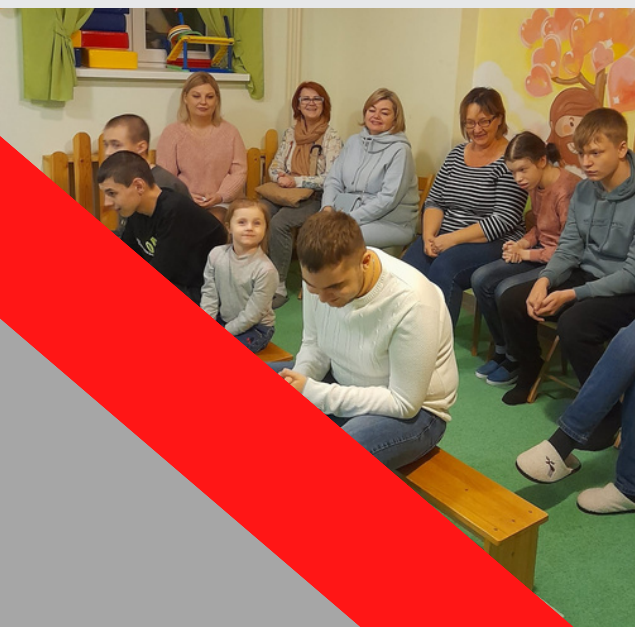
Орск, Семьи детей с ОВЗ собрали продуктовые наборы для детей из Детского центра