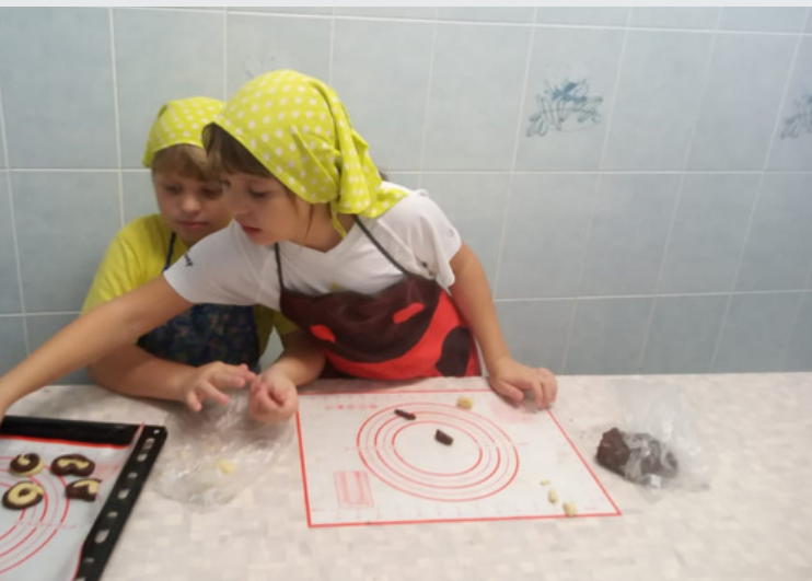
Маркс, Печенье из «Вифлеема»