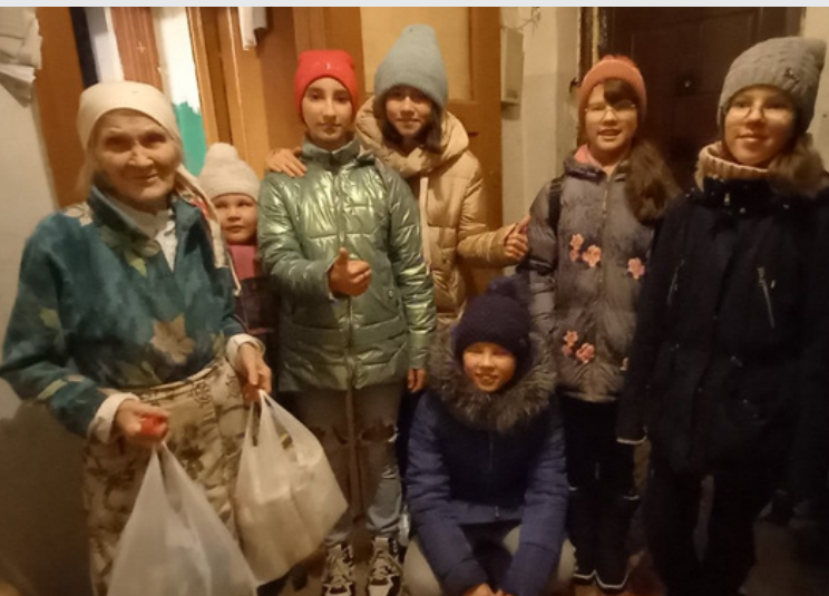
Маркс, Витамишки внимания